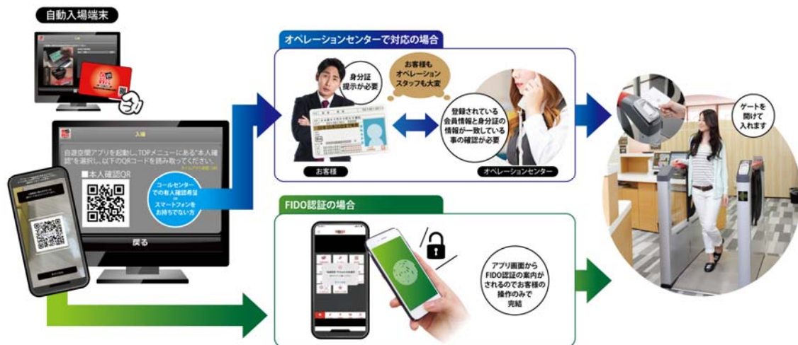
セルフ店舗システムでの FIDO 認証利用イメージ