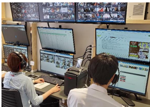
当社サービスデスク